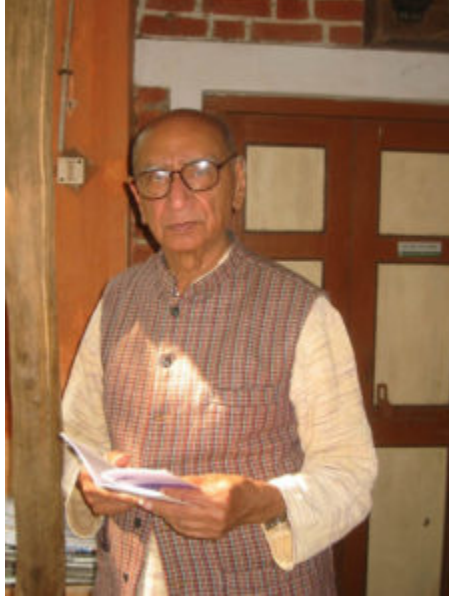
સર્જક નારાયણ દેસાઈ

નારાયણ મહાદેવભાઈ દેસાઈ(જ. ૨૪ ડિસેમ્બર ૧૯૨૪) જેટલા ચરિત્ર-લેખક તરીકે જાણીતા છે એટલા જ, અનેક સ્થળે પ્રેરક અને રસપ્રદ ગાંધીકથા કહેનાર તરીકે જાણીતા છે. વેડછી(દ. ગુજ.)ના સંપૂર્ણ ક્રાન્તિ વિદ્યાલય-ને પોતાનું કર્મસ્થાન બનાવીને એક