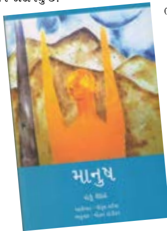
(માનુષ: હકુ શાહ : આલેખન : પીયૂષ દઈયા અનુવાદ : મોહન દાંડીકર)

ગાંધીજીને મેં પ્રકૃતિ સાથે જોડવાનો પ્રયત્ન કર્યો હતો. આ શ્રેણી - “નૂર ગાંધીનું : મારી નજરે” માટે પ્રસંગો તો ઘણા હતા. આઝાદીના, આશ્રમના, રચનાત્મક કાર્યક્રમના. ગાંધીજીનું એક વાક્ય છે - ધ સુપ્રિમ કન્સીડરેશન ઈઝ મેન. ‘સાબાર ઉપર માનુષ સત..’ ‘નહીં માનવીથી અદકેતું કોઈ...’ આ વાક્યને કેન્દ્રમાં રાખીને પણ મેં એક કોલાજ બનાવ્યું હતું. એ મને મારા આત્માની વધુ નજીક લાગે છે. આ વાક્ય મારે માટે અંધકાર અને પ્રકાશ સાથે જોડાયેલું છે.