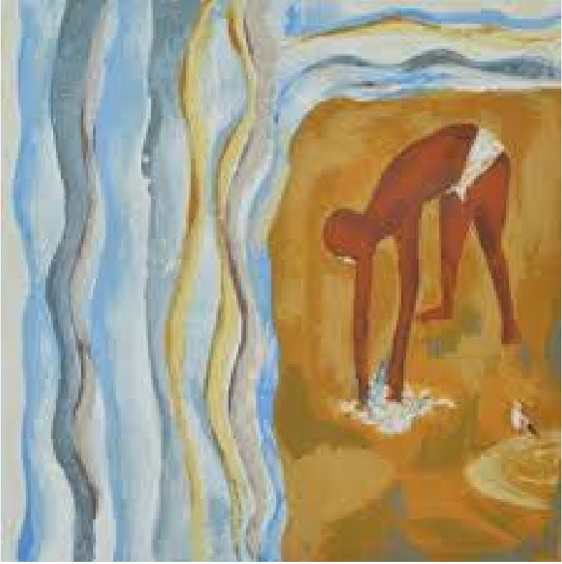
મીઠાનો સત્યાગ્રહ - ચિત્રકાર : હકુ શાહ