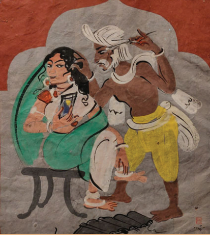
કાન સાફ કરનાર

હરિપુરાના પોસ્ટરો ભારતીય ગ્રામીણ જીવન અને સંસ્કૃતિનું દર્શન કરાવે છે જેમાં આબેહૂબ આધુનિકતાવાદી ગ્રાફિક ગુણવત્તા સાથે આકર્ષક ભારતીય માટીની મહેક આપતી