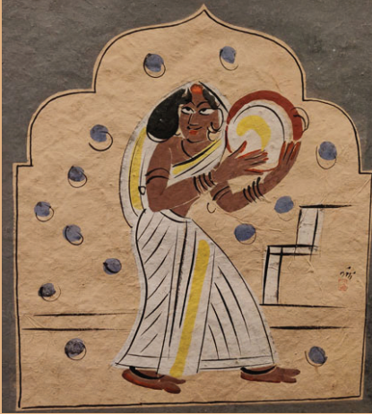
દુગડુગીવાળી (ખંજરીવાળી છોકરી)

દરવાજાઓ, થાંભલાઓ, પ્રદર્શન, સ્ટોલ્સનું કલસ્ટર, છાણવાળા આશ્રયસ્થાનો, લેન્ડસ્કેપ ગાર્ડન, મીનિંગ વિસ્તારો અને રહેણાંક તંબુઓ તમામને વિવિધ રંગોની વાંસ, છાલ અને ખાદીની સ્થાનિક સામગ્રીથી શણગારવામાં આવ્યા હતા. માટીના વાસણો અને વાસણો ડિઝાઇનોથી શણગારેલા હતા; પંક્તિઓમાં લટકાવવામાં આવેલા ડાંગરના ઘાસના વાસણો, ટોપલીઓ અને શેરડીનું કામ - સ્થાનિક કારીગરોના હાથે બનાવેલું - આ બધાનો ઉપયોગ સત્રને ભવ્ય ગ્રામીણ વાતાવરણ આપવા માટે કરવામાં આવતો હતો. આ વિશાળ સાર્વજનિક કળાના નોંધપાત્ર ઘટક તરીકે નંદલાલે અલગ-અલગ ચિત્રો બનાવવાની યોજના બનાવી જે પાછળથી હરિપુરા પોસ્ટરો તરીકે પ્રસિદ્ધ થઈ જે ભારતીય જીવનને