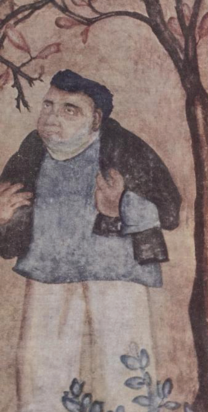
બીનોદ બિહારી મુખર્જી : વૃક્ષપ્રેમી, ૧૯૩૨, ટેમ્પેરા ઓન પેપર

મરીઝ સાહેબનો આ શેર મને મારેય માટે સાચો લાગ્યો છે. દુનિયા કહો કે જીવન યા સંસાર/સમાજ પીડા બહુ આપે છે. કાયમ કસોટીની એરણ પર આપણે હોઈએ છીએ, ત્યારે આપણને કોઈ અગોચર તત્ત્વ મદદ કરતું હોય છે. બહુ કસોટી થાય ત્યારે એ આપણી બહુ નજીક આવીને કાળજી લ્યે છે. જીવનમાં ઘણા કપરા અનુભવો થયા છે- ને ત્યારે સગાંવડાવાં કે મિત્રો કરતાં પણ કોઈ ‘અજાણ્યું’ આપણી સંભાળ લેતું રહે છે- એ મારો અનુભવ છે. એક પંખી ટહુકો આપણને ઉગારી લે છે.